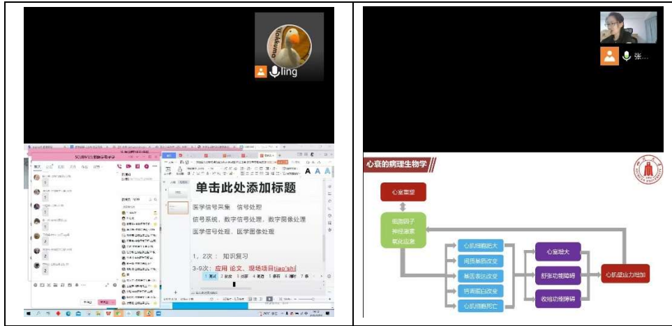
图 1 部分课程线上教学情况

根据检查情况反馈，我院研究生任课教师均已做好新生线上开课准备工作，教师与学生均能按照课表按时到课，课堂秩序良好。